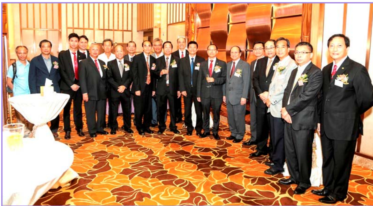
由現屆會長及上屆會長於酒會區接待一眾貴賓及各大業界友會團體代表杯酒言歡

2015年8月11日係香港給排水學會12歲的紀年誌慶，標誌著我們學會服務水務業界12個年頭了。當天晚上假座九龍灣宏天廣場百樂門國際宴會廳舉辦盛會，名為“香港給排水學會12週年會慶聯歡暨市場優質水務設備及材料展覽”晚會。當晚筵開39席寓意長長久久長做長有；展覽攤位逾17檔，承蒙主禮嘉賓－香港特別行政區水務署署長林天星太平紳士蒞臨，更設置展攤一偶展示水務署的最新資訊。其他出席部門首長有：渠務署署長、水務署助理署長、房屋署副署長、屋宇署副署長、屋宇署助理署長、香港房屋協會工程策劃總監及建造業議會高級經理等等；此外！也邀請各大友會和業界先進撥冗光臨；熱鬧場面真讓人興奮呀！